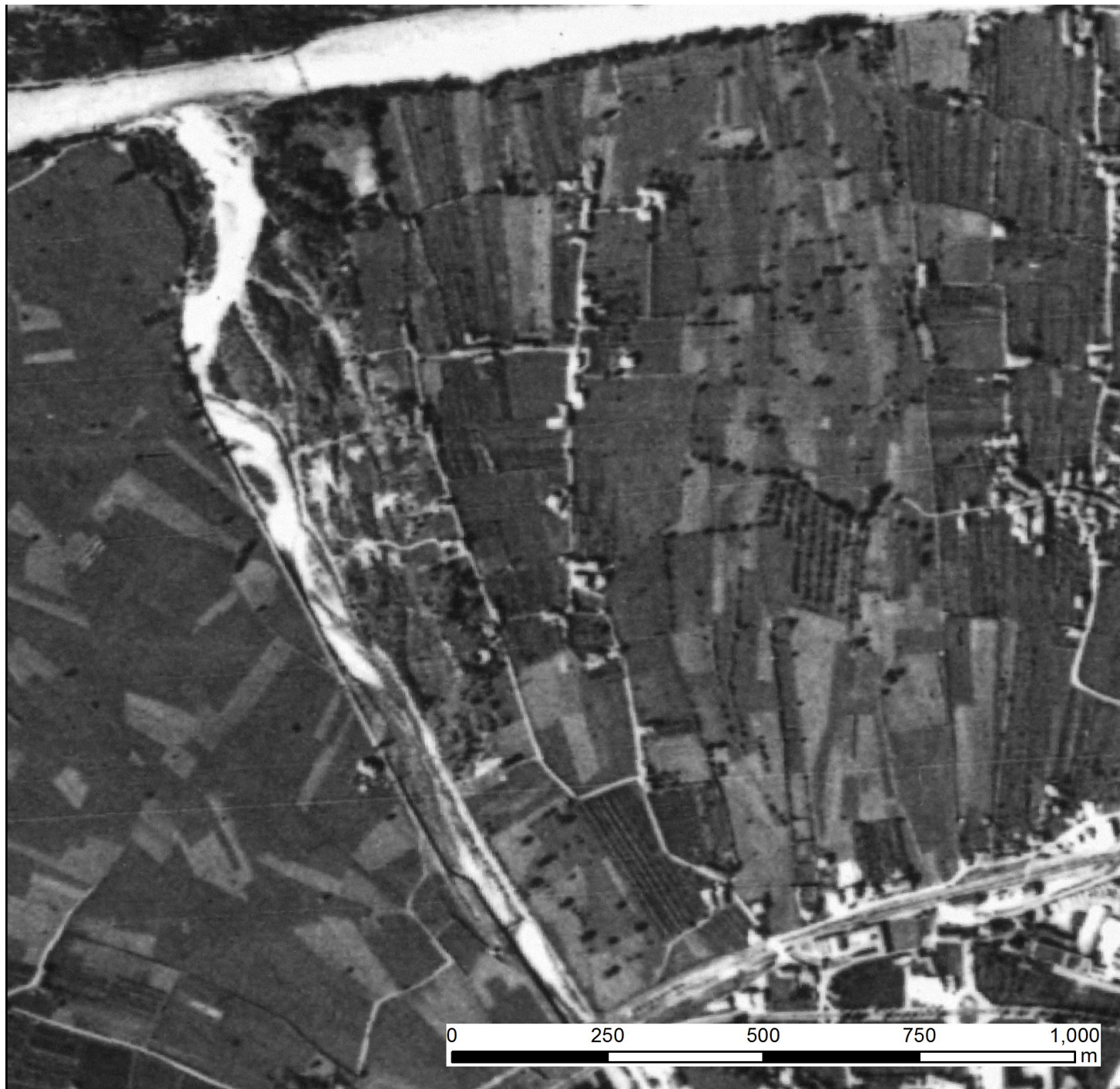
Immagine mosaicata delle foto Aeree Volo GAI (Gruppo Aereo Italiano) 1954-55