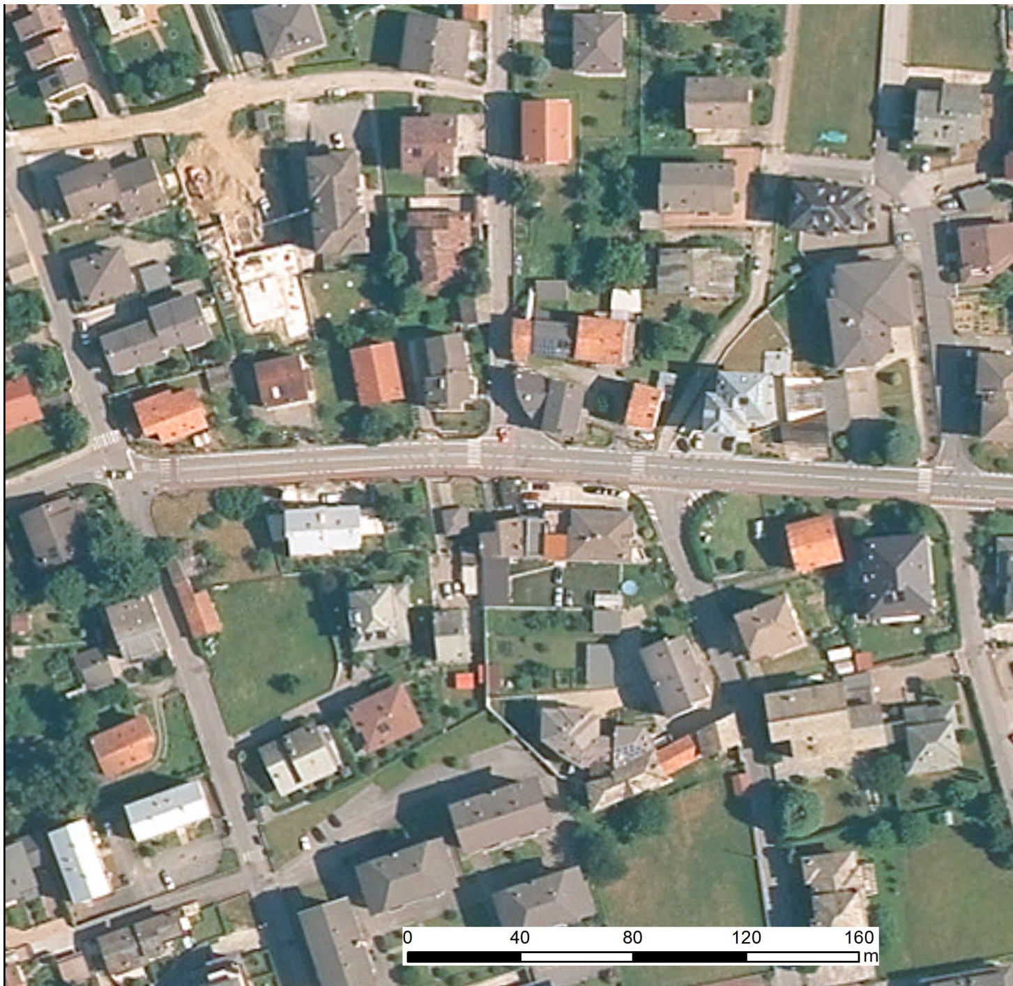
Ortofoto 2015 AGEA