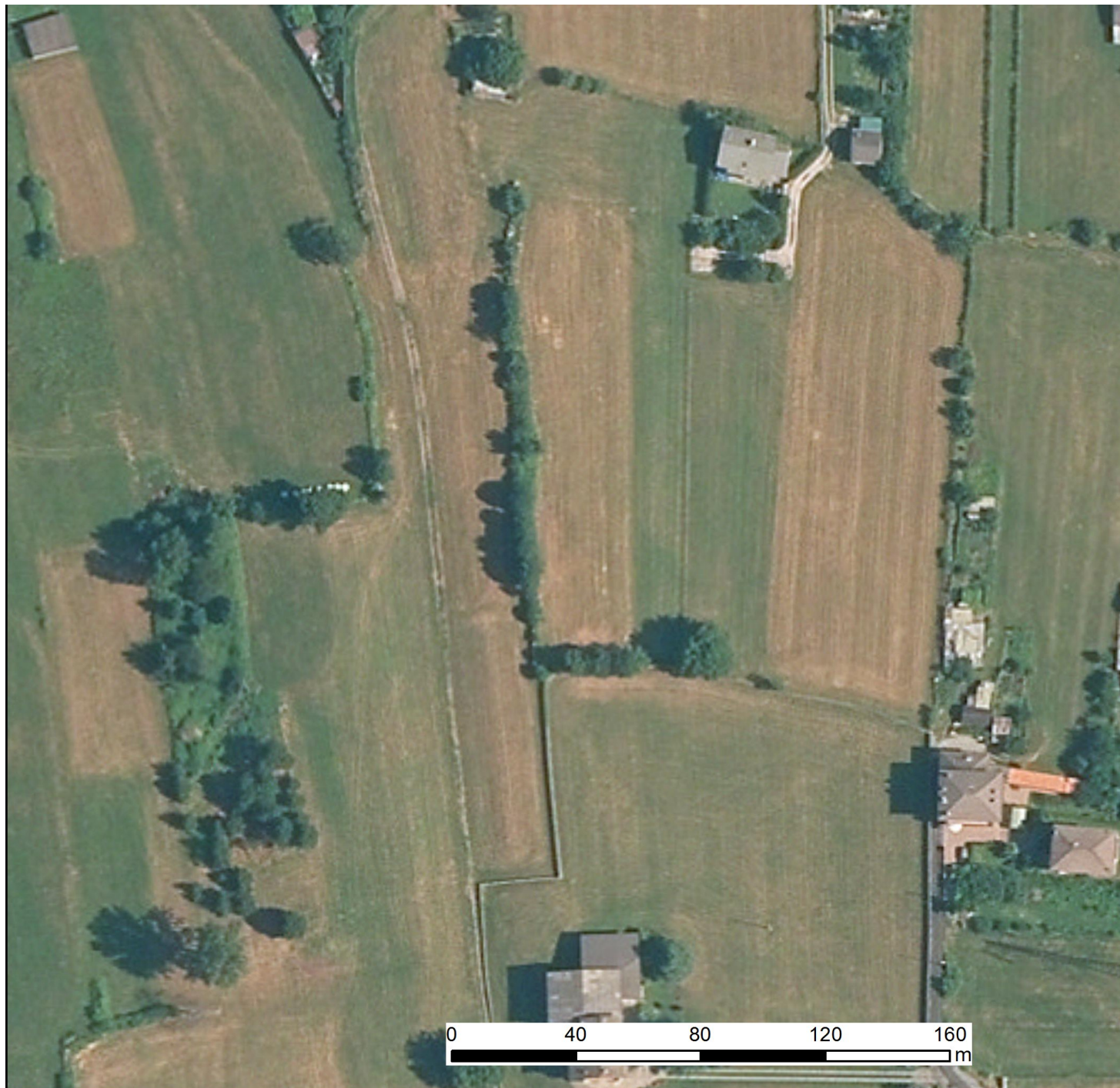
Ortofoto 2015 AGEA