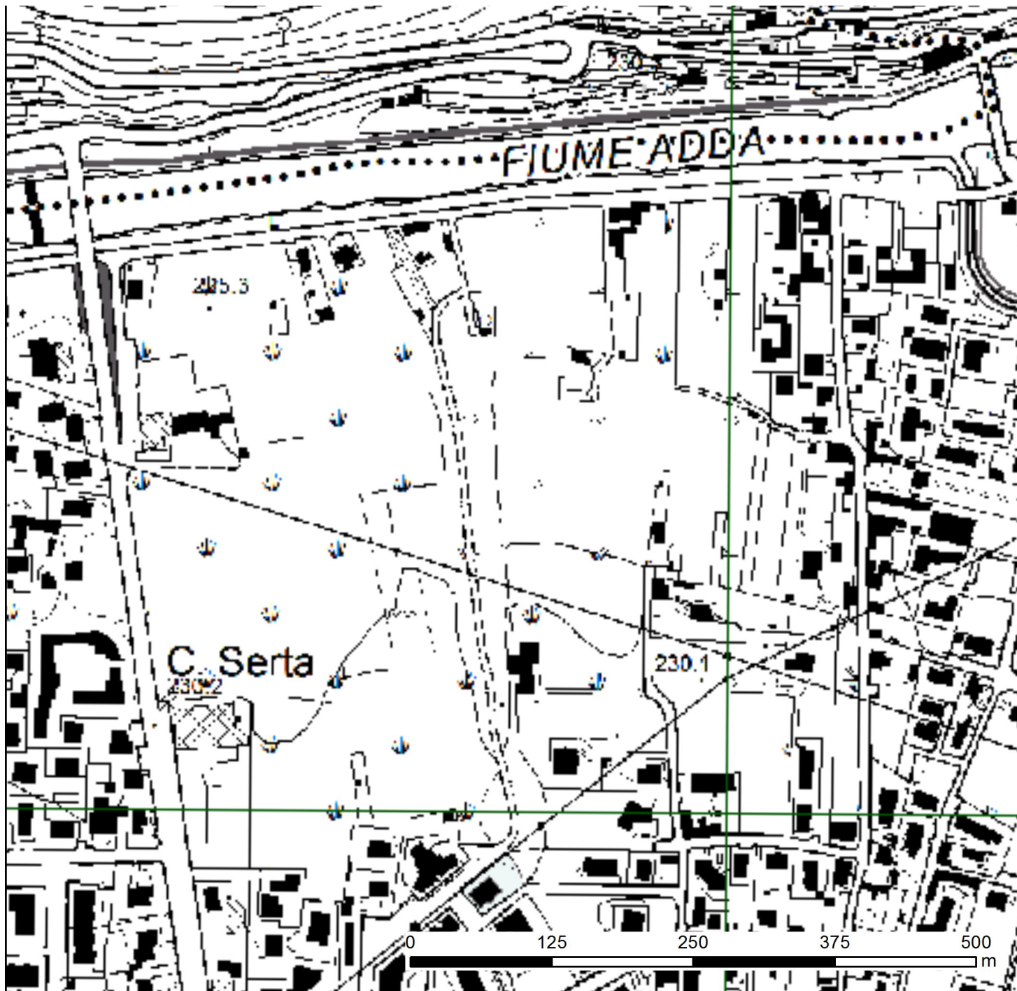
Carta Tecnica Regionale (aggiornata dai Database Topografici)